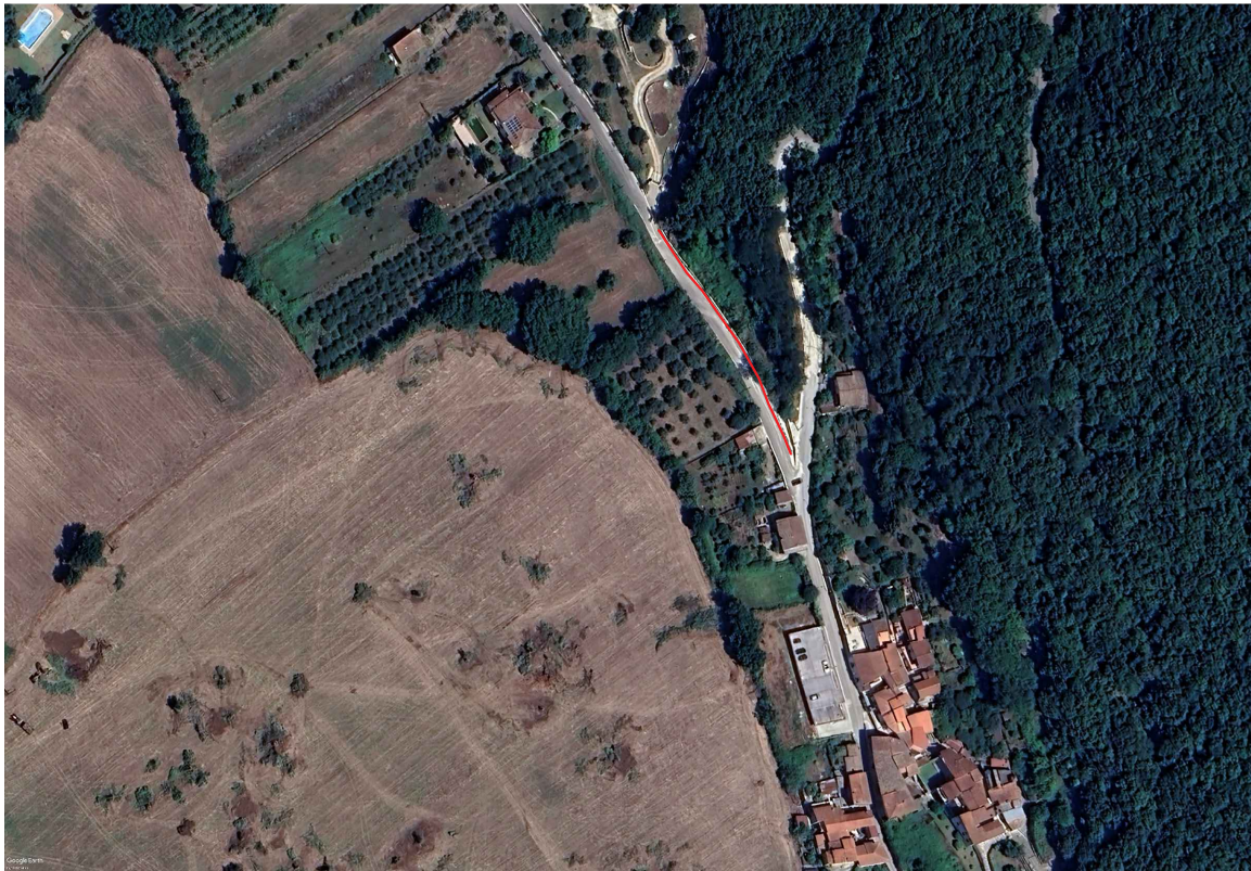
Stralcio Ortofoto con indicazione muro